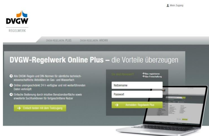
Abbildung 1 Das DVGW-Regelwerk Online-Plus stellt alle Dokumente zu den DVGW-Regeln und DIN-Normen komfortabel online zur Verfügung